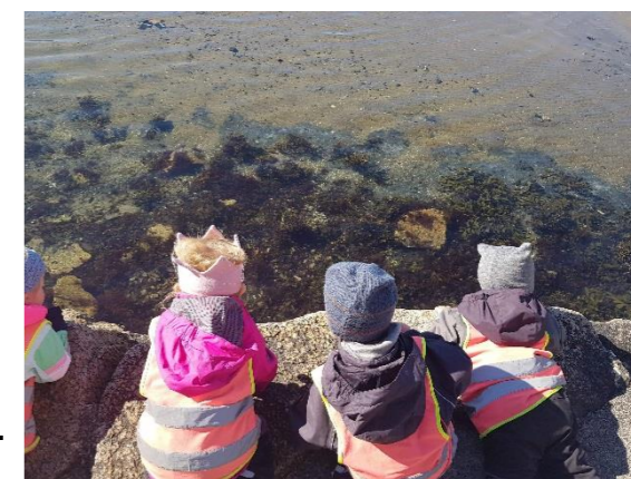
Daglige opplevelser ute

Vi har unike muligheter for bruk av naturen og sjøen, der barna kan utfolde seg og få uforglemmelige minner og venner for livet.