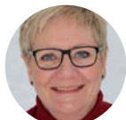
Tone Valand Bibliotek, Audnedal