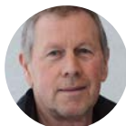
Terje Kjørkleiv Verneombud, Lyngdal