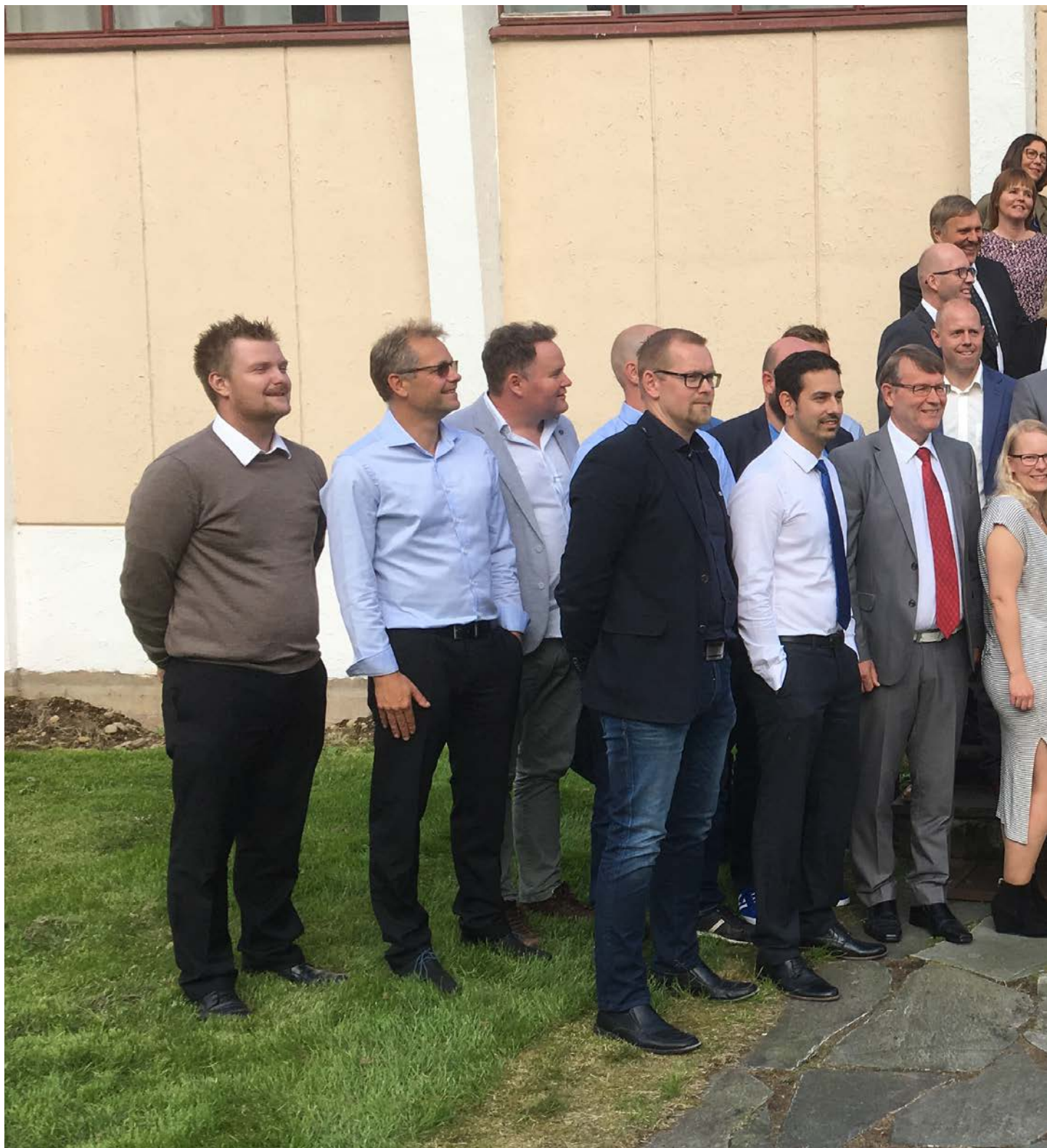
Alle kommunestyrerepresentantene fra Audnedal og Lyngdal som deltok på felles kommunestyremøte på Kvåstunet 15.6.2017.