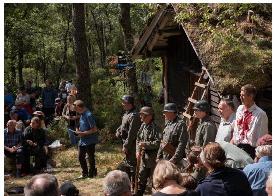
Fikk midler i 2018: Krigsminnemarkering på Rudjordheia i Kvås.