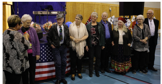
Fikk midler i 2018: Arrangementet «Amerikafeber» på Byremo.

Kriterier og søknadsskjema finner du via kommunenes hjemmesider, under nye Lyngdal.