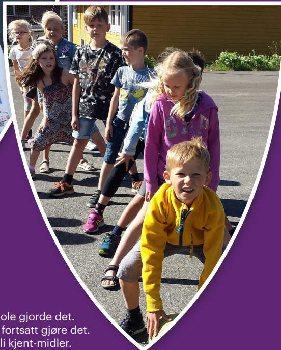
Konsmo skole gjorde det. Og du kan fortsatt gjøre det. Søke om bli kjent-midler.

Mai er måneden for finstas, flagg og feiring. Og i år har du muligheten til å delta på ekstra folkefest når et stjernespekket Tour of Norway ruller gjennom hele nye Lyngdal kommune. Oppfordringen til innbyggerne er klar: Bli med på festen!